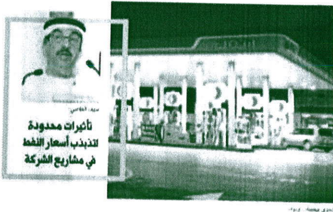
تأثيرات محدودة لتذبذب أسعار النفط في مشاريع الشركة

كشف سويل الفلاسي الرئيس التنفيذي لشركة بترول الإمارات الوطنية «إينوك» عن توجه الشركة إلى مزيد من التوسعات والاستحوادات الخارجية في السنوات القادمة ضمن دراسة لفرص المتاحة أمام الشركة للتغدير من الأسواق العالمية، بما يتواءم لها من حيز استراتيجي وبمجموع من أولويات واستراتيجيات الشركة من أجل أن تتمكن الشركة الخارجية في كل من المغرب وسنغافورة وجنوبي وكوريا الجنوبية والصين، كما تتأثر بشكل كبير بتذبذب أسعار النفط عالمياً حيث انخفضت على الشركات المنافسة في السوق.